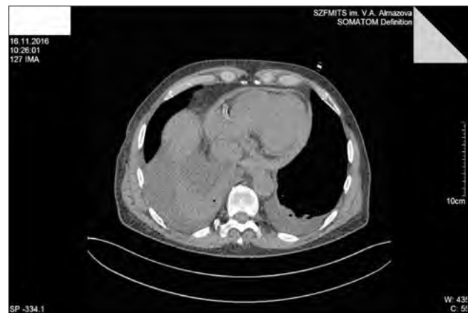
Рисунок 1. МСКТ органов грудной клетки от 16.11.2016. Правосторонний гидроторакс, гемоперикард (?) с расхождением листков перикарда до 14 мм. Незначительное количество жидкости в левой плевральной полости.

икоту) больной был экстренно госпитализирован в ЦРБ по месту жительства, где при рентгенографии органов грудной клетки был выявлен правосторонний гидроторакс, падение уровня гемоглобина до 92 г/л. (исходный при выписке от 10.11.2016 – 142 г/л), уровень эритроцитов – 3,06 \times 10^{12}/\text{л} . Проведена инфузионная терапия. 16.11.2016 пациент переведен в СЗФМИЦ им. В. А. Алмазова. При поступлении состояние пациента относительно удовлетворительное, АД 110/70 мм рт.ст., пульс 64 в мин. – ритм ПЭКС. Температура тела повышалась до 37,5-38 °С. Дыхание жесткое, резко ослаблено в нижних отделах справа. При рентгенологическом исследовании подтвержден правосторонний гидроторакс с компрессией жидкостью правого легкого, левое – без особенностей. При МСКТ органов грудной клетки в правой плевральной полости - жидкостное содержимое толщиной слоя в задних отделах до 6-7 см. (рис. 1).