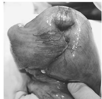
Рис. 3. Опухолевидное образование тощей кишки в виде «двустволки».