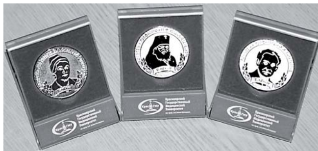
Фото 3. Медали лауреатам именных конкурсов.

Студентам-представителям вузов были вручены благодарственные письма на имя ректора «За высокий уровень подготовки научно-исследовательских