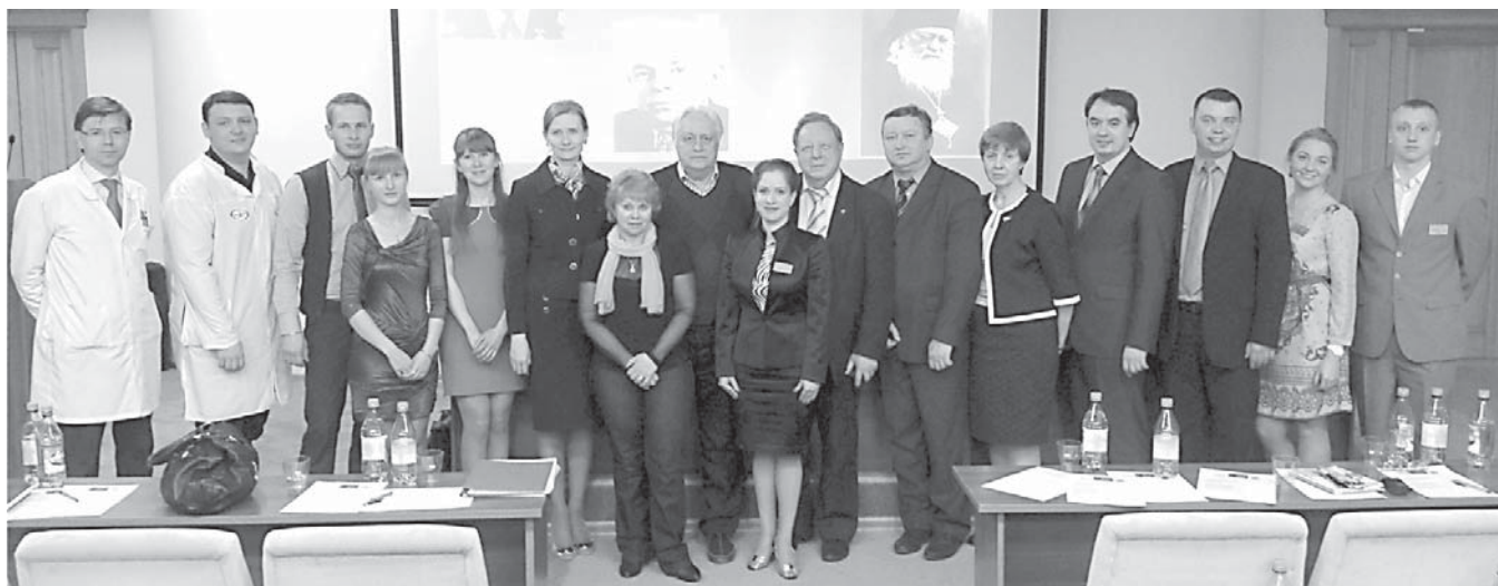
Фото 4. Конкурс лучших хирургических студенческих работ имени профессора В. Ф. Войно-Ясенецкого.

23 апреля состоялся конкурс лучших хирургических студенческих работ имени профессора В. Ф. Войно-Ясенецкого (фото 4).