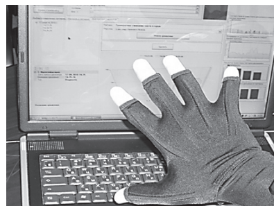
Рис. 1. Внешний вид сенсорной перчатки.

Занятия сенсорной перчаткой (рис. 1) проводились по технологии, разрешенной к применению Росздравнадзором (ФС2011/050 от 05.04.2011). Суть занятия сводилась к следующему: пациент надевал на паретичную руку сенсорную перчатку, представляющую собой набор 5 гибких