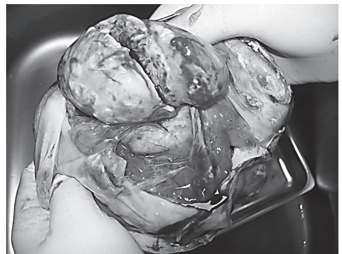
Рис. 2. Внутреннее строение зрелой кистозной тератомы яичника.